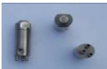
Düse GSM Mit Luftmantel

Fasspumpe mit: - Ansaugrohr, Normfass 200 Liter - Eingebauter Schwimmerschalter, 3 Kontakte