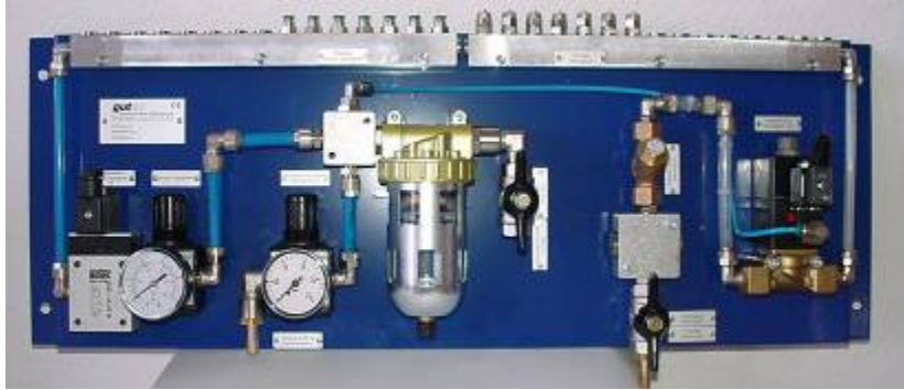
Montageblech / Versorgungseinheit für 7 Düsen – Eine Sprühzeit Erweiterbar auf 15 Düsen