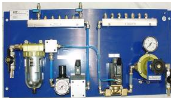
Montageblech / Versorgungseinheit für 7 Düsen Öleingang mit Öldruckminderer / Gesamtmengenregler Direktversorgung ab Fass mit Fasspumpe