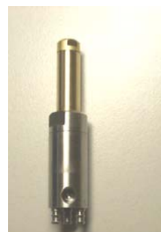
Düse GSM07-R18 Rohrbefettung innen 360°