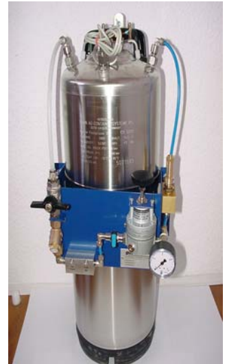
Druckbehälter 20 Liter Sonderausführung mit Feinstdruckminderer