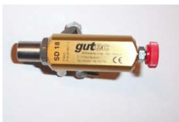
Sprühkopf Typ SD 18

Fasspumpe mit: - Ansaugrohr, Normfass 200 Liter - Eingebauter Schwimmerschalter, 3 Kontakte